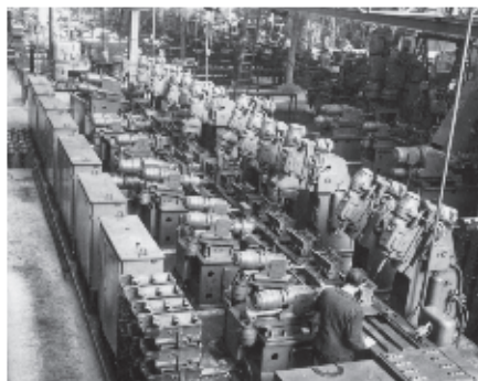
Atelier d'usinage des moteurs : machines transfert conçues par Pierre Bézier.

Les incidents sporadiques décrits par le contremaître provenaient probablement de mauvais contacts sur le dernier poste de la machine d'usinage, en liaison avec l'équilibreuse. Bien sûr, j'avais une blouse, par-dessus mon costume cravate. Jusqu'à présent, n'ayant travaillé que dans un bureau, je n'avais pas changé mes habitudes vestimentaires. C'est au retour dans le service en fin de journée, voyant les sourires des techniciens, que j'ai compris pourquoi on m'avait envoyé là-bas. Il n'était pas très judicieux, fringué comme je l'étais, de se glisser sous les machines. Et malgré toutes les précautions prises, je suis revenu assez peu reluisant de cette aventure. Le lendemain, ce fut jean et combinaison pour me protéger des pieds à la tête afin de pouvoir continuer