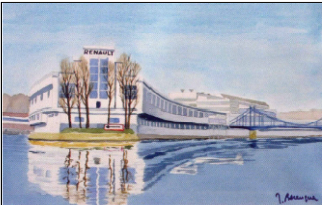
Aquarelle Jean Berenguer